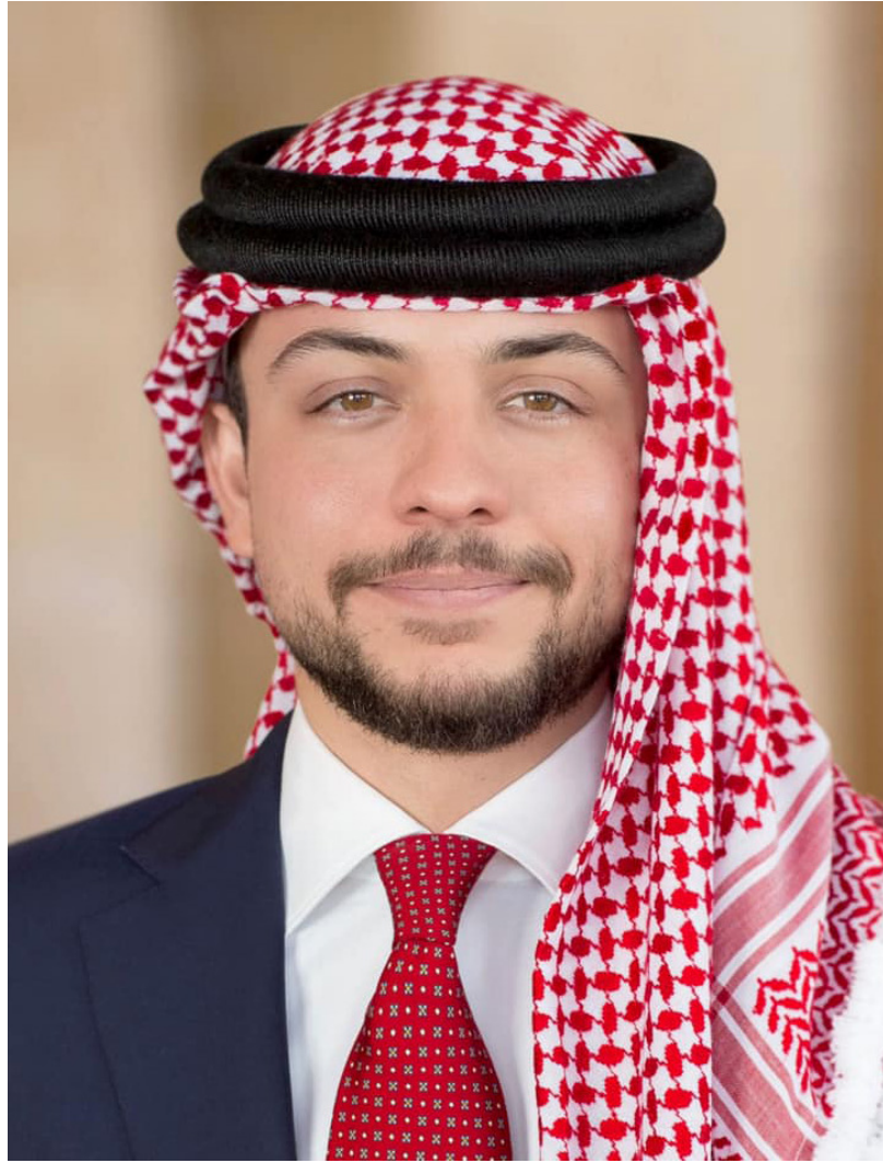
صاحب السمو الملكي الأمير الحسين بن عبد الله الثاني ولي العهد المعظم