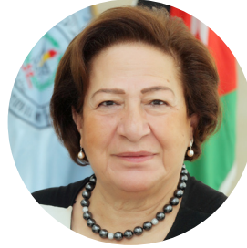
نهى أبو منة شنوده نائب الرئيس