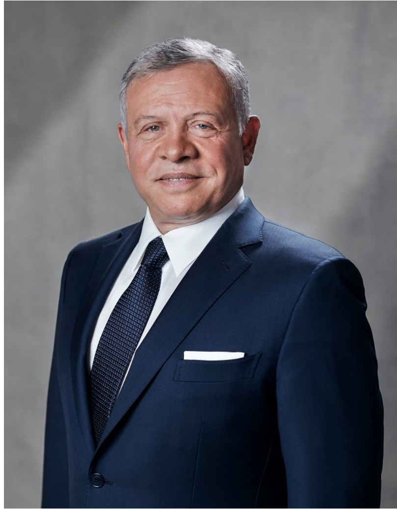
حضرة صاحب الجلالة الهاشمية الملك عبد الله الثاني ابن الحسين المعظم