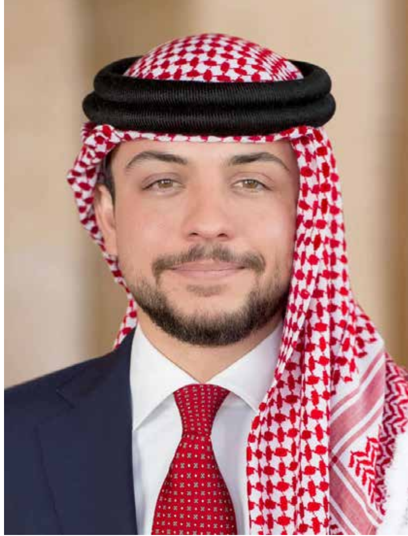
صاحب السمو الملكي الأمير الحسين بن عبد الله الثاني ولي العهد المعظم