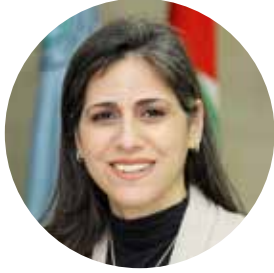
دينا رعد يغمم