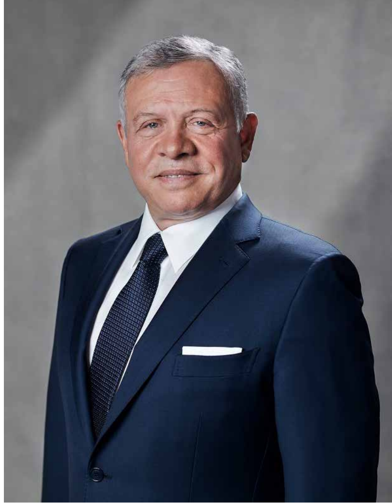
حضرة صاحب الجلالة الهاشمية الملك عبد الله الثاني ابن الحسين المعظم