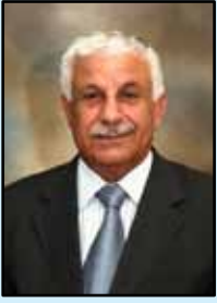
إعداد الياس شفيق نينو

الجديدة التي لا سلطان للموت عليها. إن عيد القيامة هو عيد قيامة قلوبنا من موت الخطيئة والحقد والعداوة . وختامًا نسأل القائم من بين الأموات أن يحفظ شعبنا