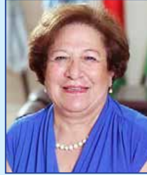
نهى أبو منه شنوده نائب الرئيس