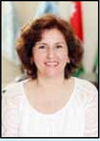
بقلم : نرمين ميشال سنداحة مقرر اللجنة المدرسية

مسيرتهم نحو المستقبل الواعد، فقد تسلّحوا بالعلم النافع والثقة بالنفس وبالتقافة الخيرة في جوّ مفعم بالمحبة والعطاء والتحفيز. ذكرى كلّ طالب وطالبة محفورة في أذهان كلّ من شارك في