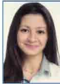
نالا مخانيل وكيله A١ - *A٦