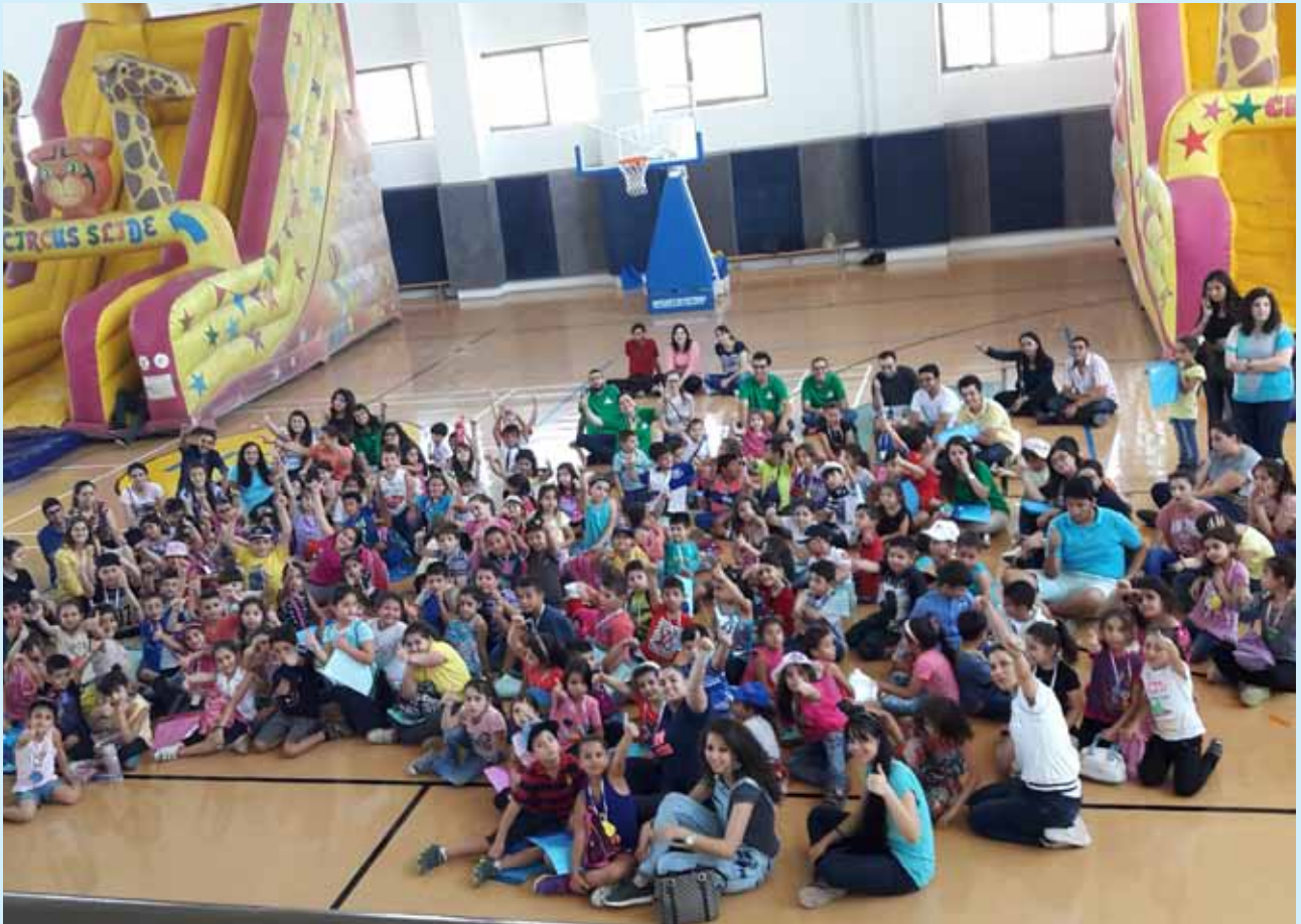
يوم الطفولة والذي أقيم في الصالة الرياضية في المبنى الثقافي الرياضي

وقد تم دعم وتمويل هذا النشاط من شركة دهانات ناشونال وبمشاركة ١٥٠ طفلاً و ٤٥ خادماً ومساعداً من جميع مراكز مدارس الأحد التابعة للجمعية في مختلف أنحاء المملكة إضافة إلى مشاركة من أطفال مركز مدارس الأحد/عجلون. بعد تناول وجبة الإفطار إبتدأ الجزء الأول