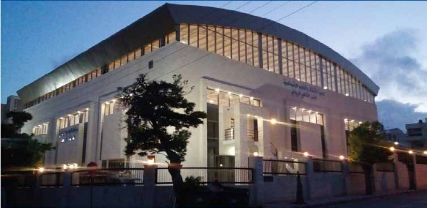
قاعتا المبنى الثقافي الرياضي