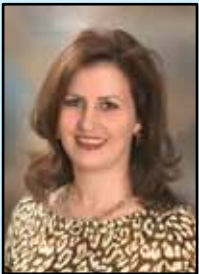
إختارتها : سائده الشامي

تبلغ مساحة الموقع حوالي ٥٠ دونما، ويجاوره محيط يعتبر الأغنى في تاريخ الحضارات القديمة حيث يرتبط بسيرة النبي يحيى « يوحنا المعمدان » عليه السلام الذي أمضى معظم حياته في وادي الأردن. يسمى هذا الموقع في سجلات دائرة الاراضي بحوض عين سالم، كما ورد ذكره في (انجيل يوحنا ٣: ٢٣) باسم عين نون قرب سالم. وأمام هذا الاكتشاف العالمي بجوار موقع عماد السيد المسيح نأمل أن يحظى هذا المكان بالإهتمام