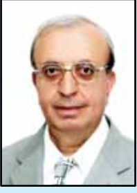
بقلم: أ.د. يوسف مسنات

على حقيقتها، فهو رجاؤنا فلا نكتب، وهو مرشدنا فلا نضل، وهو عزائنا فلا نحزن، وهو ملجأنا فلا نجزع. وهو الذي قال لنا: « لا تسألوا عما تاكلون