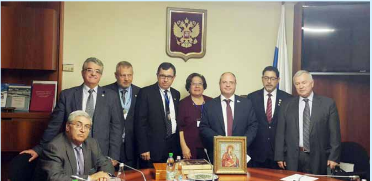
صورة جماعية مع السيد سيرجيه غافريلوف الإثنين ٢٨/٩/٢٠١٥

كما التقى الوفد للجنة البرلمانية الروسية التي تعنى بحماية التراث المسيحي في مقر الدوما «البرلمان الروسي» برئاسة السيد سيرجي غافريلوف حيث أشار الى جهود اللجنة بإسترجاع أملاك الكنيسة الروسية في فلسطين . كما أضاف بأن للجنة دوراً كبيراً في إرسال المساعدات الإنسانية الى سوريا والتي يتم جمعها من أفراد الشعب الروسي كما أشاد بدور القيادة الأردنية في إستقبال وإيواء اللاجئين السوريين وتوفير سبل العيش الكريم لهم .