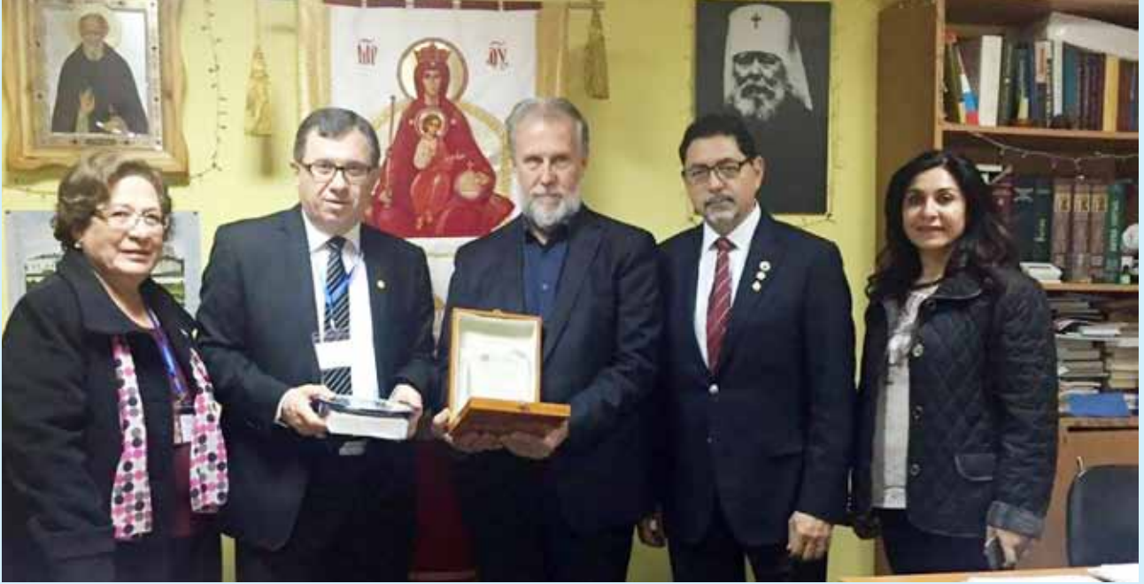
صورة جماعية مع رئيس تحرير جريدة روسيا العظمى الإثنين ٢٨/٩/٢٠١٥

كما قام الوفد يوم الإثنين ٢٨/٩/٢٠١٥ بزيارة رئيس تحرير صحيفة روسيا العظمى السيد أندريه نيقولايفيتش ، وقد شرح رئيس التحرير بأن هذه الجريدة تعنى بتوطيد العلاقات وتعزيزها بين المجتمع الروسي والكنيسة الأرثوذكسية والحفاظ على الثقافة الأرثوذكسية والقيم الأخلاقية داخل المجتمع الروسي وقد أشار رئيس التحرير بأن الصحيفة تصدر شهرياً ٥٠ ألف نسخة توزع في جميع أنحاء روسيا والجمهوريات السابقة والمهاجر في أميركا وأستراليا وقد وعد الوفد الأردني بإرسال أخبار المؤسسات الأرثوذكسية في الأردن لنشرها في الصحيفة.