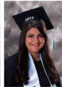
سوار عادل قسيسية ٪٩٢,٤