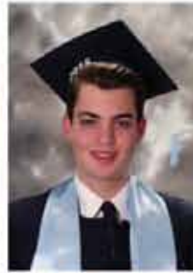
نقولا رالد حيبيل ٪٩١,١