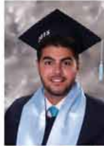
فصي جاسر البقاين ٩٥,٩٪