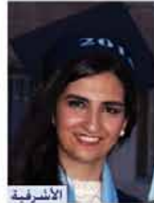
الاشرفية الفرع العلمي ٩٥,٧٪