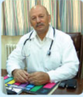
طبيب الصحة المدرسية