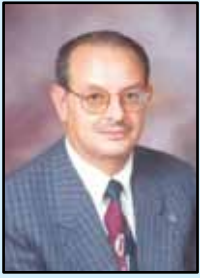
د. عودة السلطان

١٩٤٦ ميلادية حيث نال الأردن حريته واستقلاله عن الاستعمار البريطاني بقيادة ابن الثورة العربية الكبرى الأمير عبدالله بن الحسين حيث أعلنت الأمم المتحدة