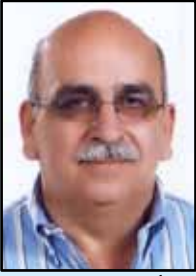
أعدّها بتصريف المهندس جابي عوض