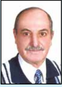
إعداد م. يوسف هندية

٢ - المياه الجوفية غير المتجددة: وتوجد في أحواض جيولوجية تعتبر من أقدم التتابعات الرسوبية الحاملة للماء وأعمقها مثل مياه الديسي/ سهل الصوان التي