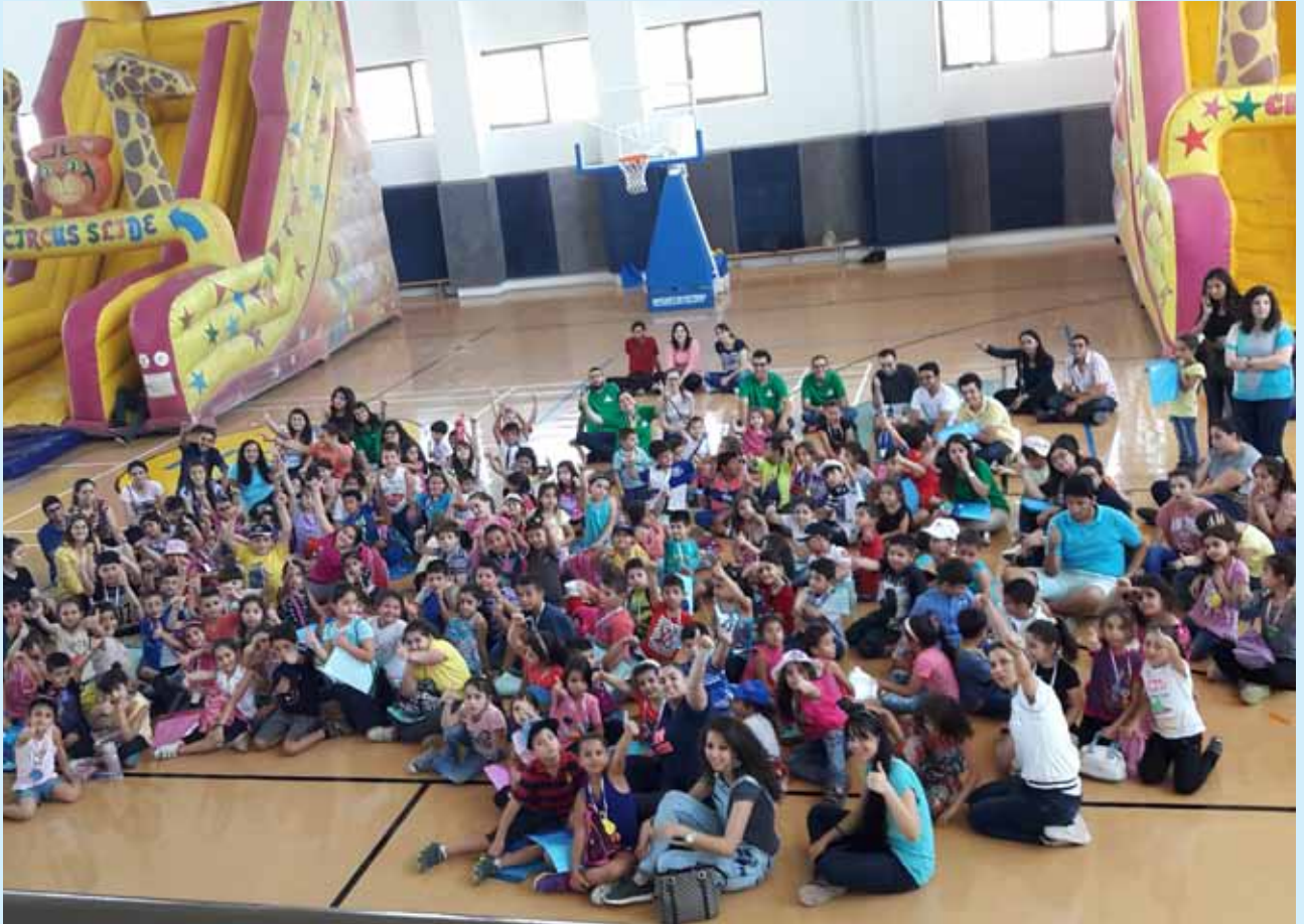
يوم الطفولة والذي أقيم في الصالة الرياضية في المبنى الثقافي الرياضي

وقد تم دعم وتمويل هذا النشاط من شركة دهانات ناشونال وبمشاركة ١٥٠ طفلاً و ٤٥ خادماً ومساعداً من جميع مراكز مدارس الأحد التابعة للجمعية في مختلف أنحاء المملكة إضافة إلى مشاركة من أطفال مركز مدارس الأحد/عجلون. بعد تناول وجبة الإفطار إبتدأ الجزء الأول