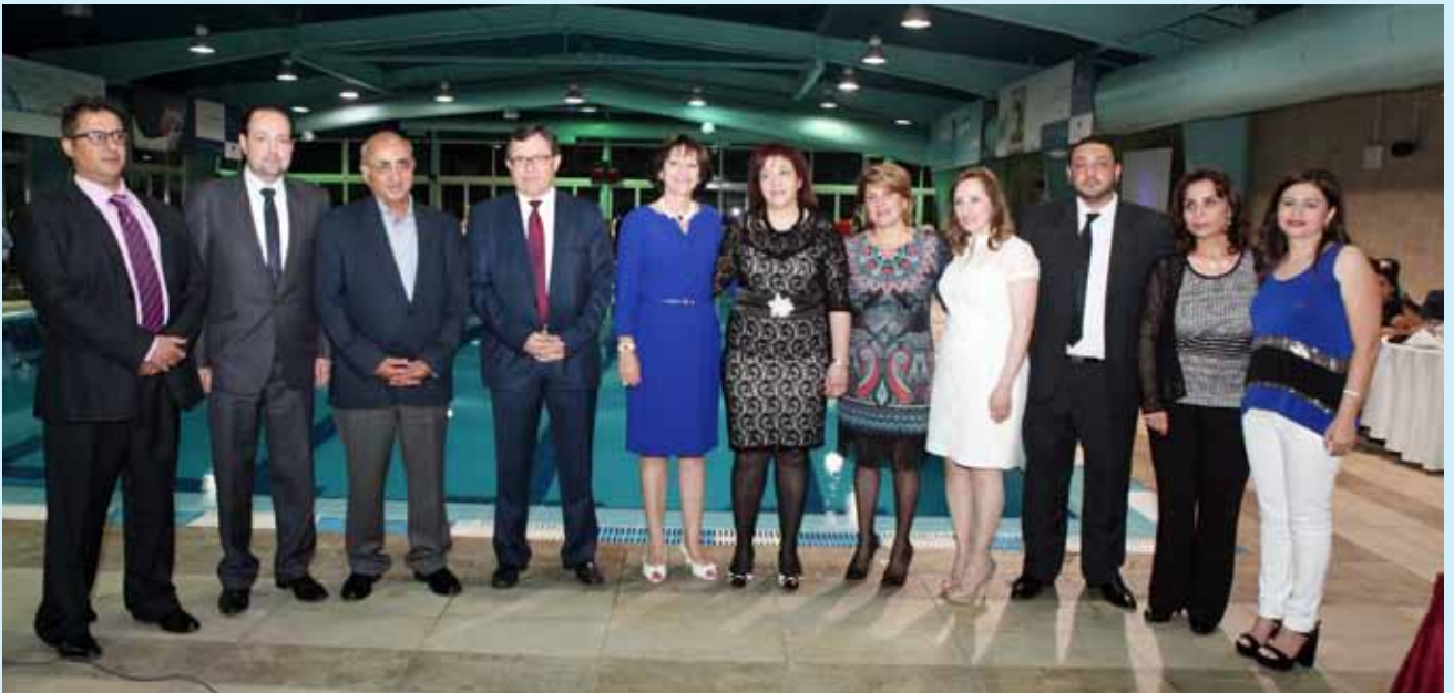
صورة جماعية لرئيس الهيئة الادارية مع المكرمين