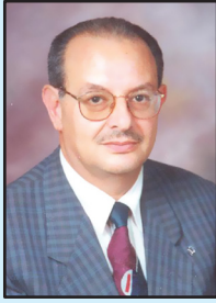
الدكتور: عودة السلطان