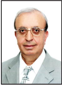
بقلم: أ.د. يوسف مسانت

الحادي والعشرون من آذار يوم مميز من كل عام، فهو عيد الأم وعيد الكرامة وإطلالة الربيع، وفيه تستكمل الهيئة الادارية لجمعيتنا، التي نالت حديثاً وباقتدار ثقة الهيئة العامة، برنامجها في الإرتقاء بأداء مؤسساتنا التعليمية وتنمية موارد الجمعية واستثمار المبنى الثقافي - الرياضي بمزيد من الأنشطة الثقافية والرياضية ومتابعة تنظيم أرض أم الكندم مع المكتب الهندسي الاستشاري لاستثمار هذه الأرض بما يحقق أهداف وغايات الجمعية على الوجه الأمثل.