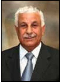
إعداد: الياس شفيق نينو

تابع ميلاد السيد المسيح بالجسد - العدد الماضي رقم ٢٤٦