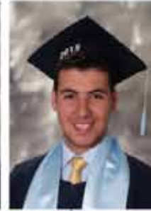
انثوني عطالته هندبلق ٪٩١,٣