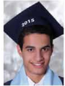
ريبال ماجد النصري الفرع العلمي ٩٣٪