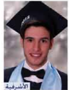
الأشرفية سالم خضر العيش الفرع العلمي ٨٩,١٪