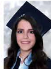
الفرع العلمي ٩٠,٩٪ سميرين جب العوه