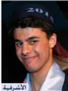
الاشرفية الفرع العلمي ٩٤,٥٪