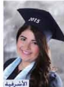
الاشرفية جولي غسان الدير إدارة معلوماتية ٨٥,٦٪