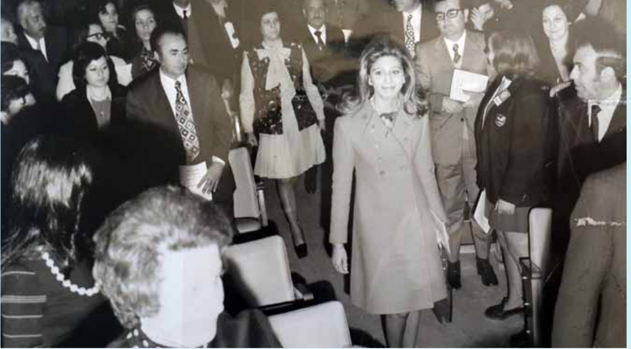
تحت رعاية حضرة صاحبة الجلالة المرحومة الملكة علياء الحسين قدمت المدرسة الوطنية الارثوذكسية مسرحية اوسكار وايلد « مروحة الليدي وندر مير » عام ١٩٧٣ تمثيل طلاب المدرسة