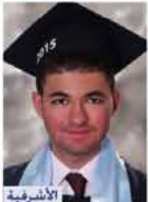
الاشرفية عودة البير قندلفت إدارة معلوماتية ٨٩,٥٪