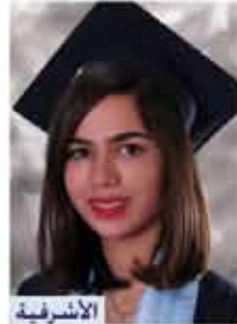
الاشرفية إدارة معلوماتية ٩٤,٩٪