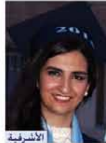
الاشرفية الفرع العلمي ٩٥,٧٪