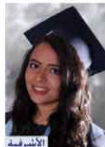
الأشرفية مارينا امين جريس إدارة معلوماتية ٨٠,٤٪