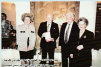
رئيس جامعة القدس الدكتور محمد عبد الله مع وفد من جامعة المعلم سميح في بيروت

بسخاء لجمعيةنا، وبلا أعقاب التصميم لمشروعات البناء التابعة للجمعية، وبلا بناء كنيسة القديسين فلسطين وهيلاته بلا مرج الحمام، وبلا حملات معونة الشتاء من خلال ابنته الفاضلة السيدة ليماء.